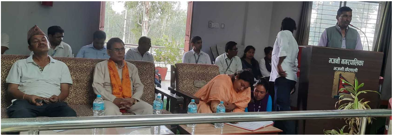
Figure 1 सार्वजनिक सुनुवाई भजनी