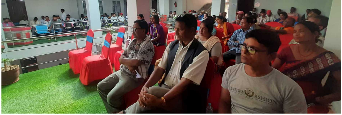
Figure 3 कार्यक्रमका सहभागीहरु