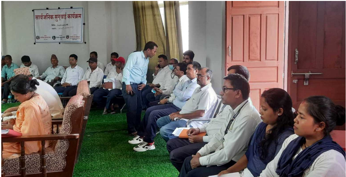
Figure 2 जवाफ दिन तयार प्रमुख उपप्रमुख र कर्मचारीहरु