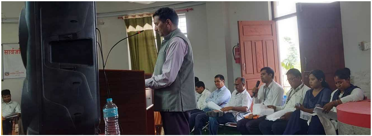
Figure 4 प्रतिवेदन प्रस्तुत गर्दै सहजकर्ता ।